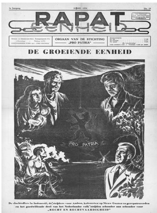
Rapat 1954.

de propagandisten van de Rijkseenheidsbeweging, voor wie er een nauwe samenhang bestond tussen de Nieuw-Guinea kolonisatie en de steun voor een onafhankelijke Republiek der Zuid-Molukken (met onder meer de eilanden Buru, Seram, Amboina, Aru, Wetar) een gebied dat (zuid)westelijk aan Nieuw-Guinea grensde. Gerbrandy, die zich zo had gekeerd tegen een vergelijk met de Republiek, was ook een prominente pleitbezorger van de Molukse zaak. Oude koloniale banden tussen Nederland en Ambon, maar ook een gedeeld protestants-christelijke geloof en Ambonees verzet tegen de Japanse bezetter, waren de belangrijkste bestanddelen van deze solidariteit. De Republiek Maluku Selatan (RMS) die op 25 april 1950 was uitgeroepen, was een half jaar later al weer onder de voet gelopen door Indonesische troepen. De solidariteitsbeweging Door de Eeuwen Trouw (DDET) wist echter nog jarenlang aanzienlijke steun onder de Nederlandse bevolking te winnen voor de Molukse zaak. Het had in de jaren vijftig een veertigtal afdelingen door heel Nederland en bracht een blad De Stem van Ambon uit dat begin jaren vijftig zo'n 20.000 abonnees telde. 60