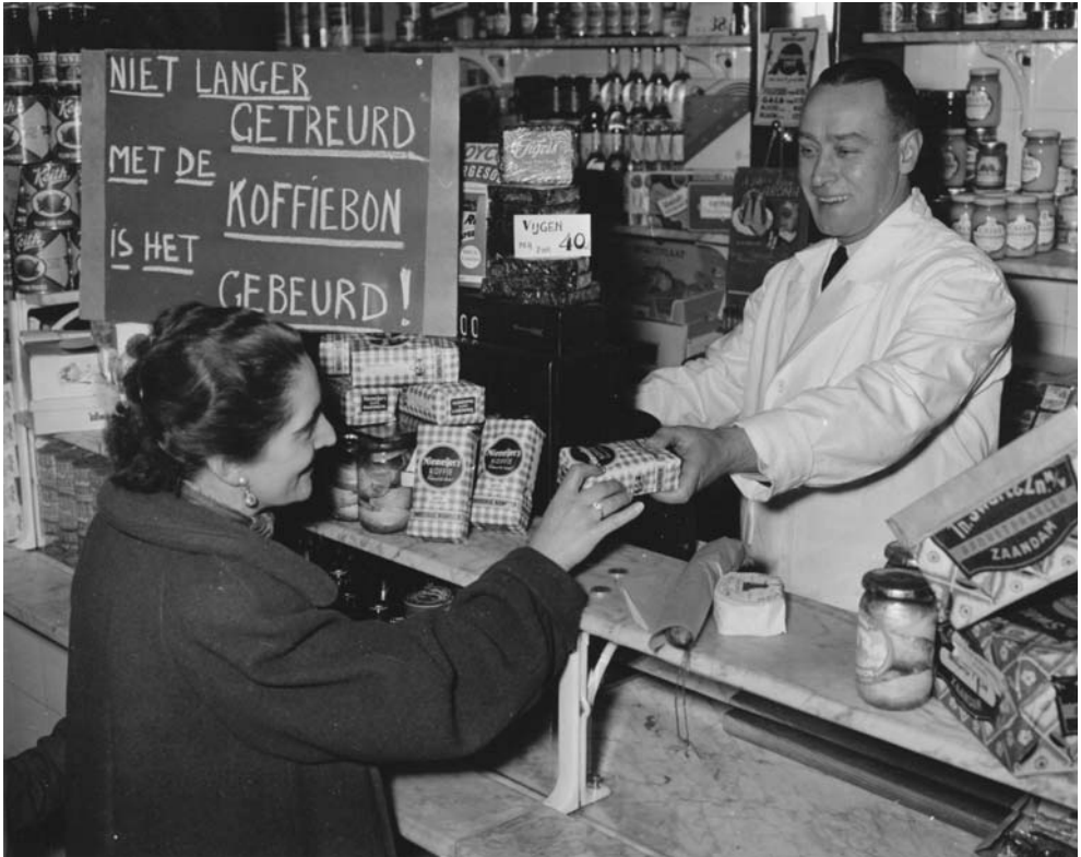
Kruidenier met bord op toonbank 'Niet langer getreurd, met de koffiebon is het gebeurd!' (Door de fotograaf geënsceeneerde foto). 13 januari 1951.

hierbij echter een belemmering. In de jaren zestig introduceerde de regering daarom een financiële regeling die moest leiden tot een sanering van de vele marginale bedrijven. Tegelijkertijd voerde de Nederlandse overheid een beleid om levensvatbare bedrijven in het мкв te ondersteunen met garanties en leningen. 27