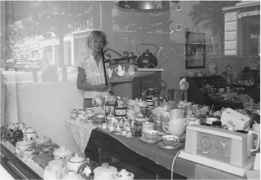
Marktkans voor nieuw ondernemer? Starter in 2009.

(pc) leidde tot een reeks gerelateerde nieuwe markten voor ondernemers: componenten, assemblage, verkoop, advies, onderhoud en de ontwikkeling van nieuwe software (toepassingen). Door innovaties en veranderingen in de omgeving ontstaan steeds mogelijkheden voor (nieuwe) ondernemers, waarvan velen het niet zullen redden, maar sommige weten te overleven en slechts een enkele groeit uit tot een grote onderneming. Anderzijds verdwijnen of krimpen er ook steeds markten voor ondernemers. Dat gold bijvoorbeeld voor waterstokers, AGF-zaken (aardappelen, groente en fruit), schillenboeren, lompenboeren, bezemmakers en schoorsteenvegers. Hierdoor worden ondernemers, die actief zijn in afstervende markten, gedwongen keuzes te maken: doorgaan, overstappen of stoppen.