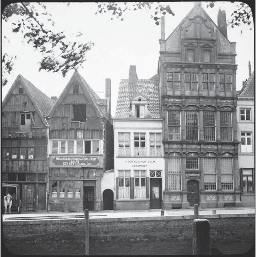
Het huis 'De Zalm' of 'In den grooten zalm', gelegen aan de Dijle, heet oorspronkelijk 'Santvliet' en is eigendom van het ambacht van de visverkopers sinds 1519. De gevel, een ontwerp van Willem van Werchtere, is het eerste voorbeeld van klassiek geïnspireerde vroeg-renaisance in België.

vleeshouwers, wevers en bakkers uitgekozen werden om een derde van de schepenenambten in te vullen. Bovendien bestonden deze beide ambachten uit invloedrijke en voornamelijk Mechelse geslachten. Tijdens de achttiende eeuw behoorde het rijke visverkopersambacht, met een ledenaantal van 150 tot mogelijk 200 suppoosten, tot een van de vijf grootste ambachten van Mechelen. 20 In tegenstelling tot de visverkopers, bestond het brouwersambacht