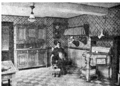
Afb. 8 'Modelkeuken', De Boerin , 3 (1928) 55.

In de woonkeuken leek alle leven geconcentreerd rond de kolenkachel. Tot aan de Tweede Wereldoorlog bleven kolen inderdaad de traditionele warmtebron op het platteland. De stadsbevolking kwam tijdens het interbellum reeds in aanraking met gas en elektriciteit als moderne warmtebronnen, maar in De Boerin werd daar nauwelijks over ge-rept. 60 De Leuvense stoof, die omwille van praktische voordelen werd aangera-den voor de boerenkeuken, was het meest structurerende element in de