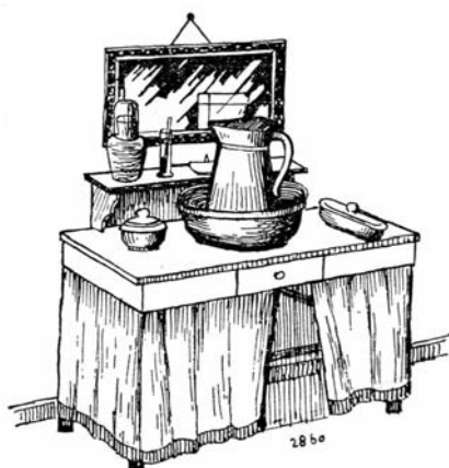
Afb. 1 'Waschtafels' van de Belgische Boerinnenbond: 1929, De Boerin, 11 (1929) 263.

In de woonnormen werd de boerin er vooral toe aangezet om de waarden van de katholieke boerenstand uit te dragen in de wijze waarop haar gezin woonde. De Boerinnenbond stond de landbouwster in deze sociale opdracht in raad en daad bij. Ze communiceerde de raadgevingen door er sociale rolmodellen aan te koppelen. De boerin zou in haar opdracht slagen wanneer ze zich aan al deze rolmodellen zou spiegelen. De sociale rollen hadden betrekking op de boerin als (1) verantwoordelijke voor de gezondheid van de gezinsleden, (2) echtgenote, (3) familiemoeder, (4) raadgeefster voor de boer, (5) lid van de boerinnengilde en (6) als vertegenwoordigster van de katholieke boerenstand.