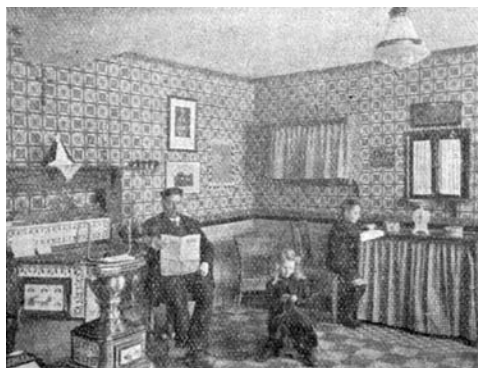
Afb. 7 'De Modelkeuken der Studiedagen', De Boerin , 7 (1927) 167. 'Model-keukenstoof', De Boerin , 2 (1928) 30.