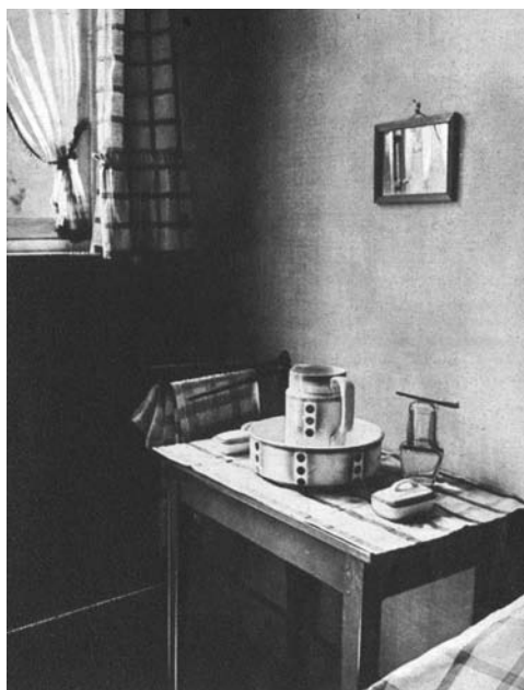
Afb. 3 De Boerin , 5 (1938) 5 (febr.), 135.