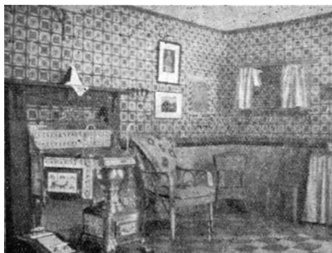
Afb. 6 Modelkeuken van de Belgische Boerinnenbond, De Boerin , 6 (1927) 124.