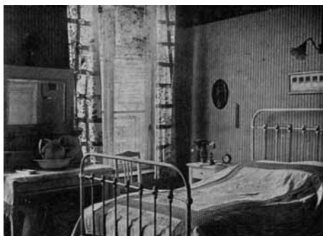
Afb. 5 'Modelziekenkamer', Ziekenverpleging , (1939) 6.

voorwerp had zijn plaats om mee het idee van reinheid te ondersteunen. 29 Er bestonden ook inventarissen van verplichte en te mijden accessoires. 30 De soberheid van de meisjeskamervariant werd expliciet verbonden met een zeer streng moreel discours.