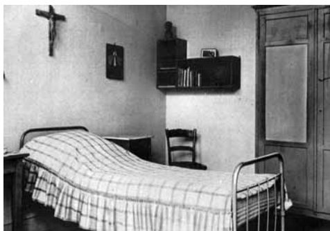
Afb. 4 Modelslaapkamer van de Belgische Boerinnenbond: 'Een eenvoudige en smaakvolle slaapkamer voor boerenmeisje', De Boerin , Jubelnummer 1911-1936, (1936) 12.