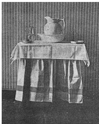
Afb. 2 'Eenvoudige waschtafel', De Boerin , 3 (1930) 78. Zie ook: Ziekenverpleging , (1939) 27.

Het sanitaire meubel bestond in essentie uit een tafel, waterkan, waterbekken en een aantal instrumenten voor lichaamshygiëne. Het eenvoudige concept moest garanderen dat elke boerin zelf een dergelijke opstelling kon realiseren. Er werd een ware handleiding gegeven voor het installeren en het onderhouden van de wastafel waarin elke handeling verwees naar specifieke aspecten van de lichaamsverzorging.