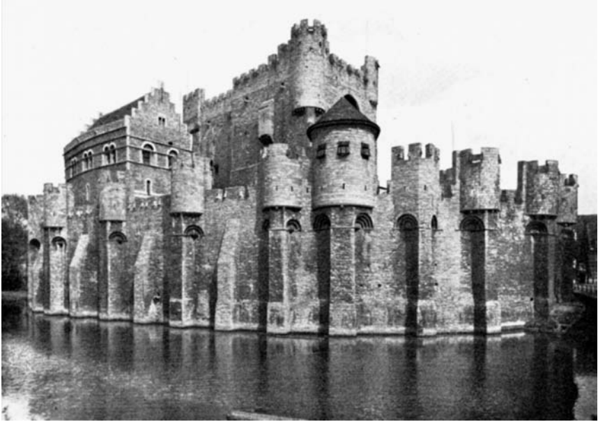
Afb. 2 Het Gravensteen in Gent.

'tquadie van Ghent ende Ypre', waarmee vooral de wevers en de vollers werden bedoeld. 66 Na de slag bij het Beverhoutsveld komen 'eenen hoop quadien' uit Brugge de zegevierende Gentse rebellen tegemoet 'twelke men seide dat smeden waren'. 67 Ook in de Chronique rimée des troubles de Flandre had men het over de 'malvais' om de rebellen mee aan te duiden. 68 Ook wel sprak men van de 'quade knechten', 69 'quaedwillende', 70 'quaetwillighe' 71 of 'qualicwillende'. 72 Zelfs kroniekschrijvers zoals de auteur(s) van het Brugse handschrift 437 (uit de traditie van de zogenaamde Excellente Cronike van Vlaenderen ) die zeker niet per definitie negatief stonden tegenover de Brugse opstand van 1436-1438, spreken zich negatief uit over deze 'qualicwillende', de radicalen