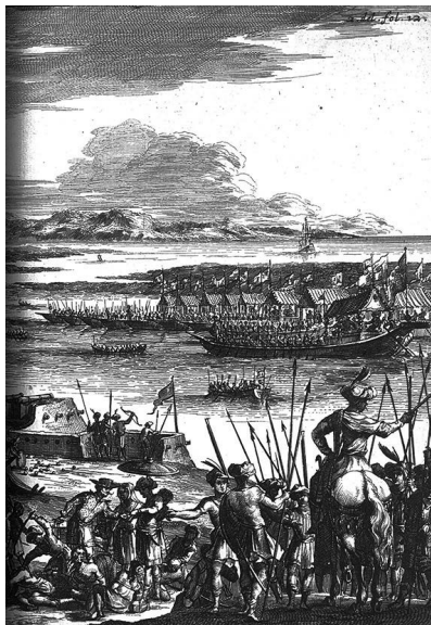
Illustratie 3: De handel in slaven nabij Pipeli (India), tweede helft zeventiende eeuw. Wouter Schouten, Oost-Indische voyagie (Amsterdam 1676) derde boek, pagina 12.