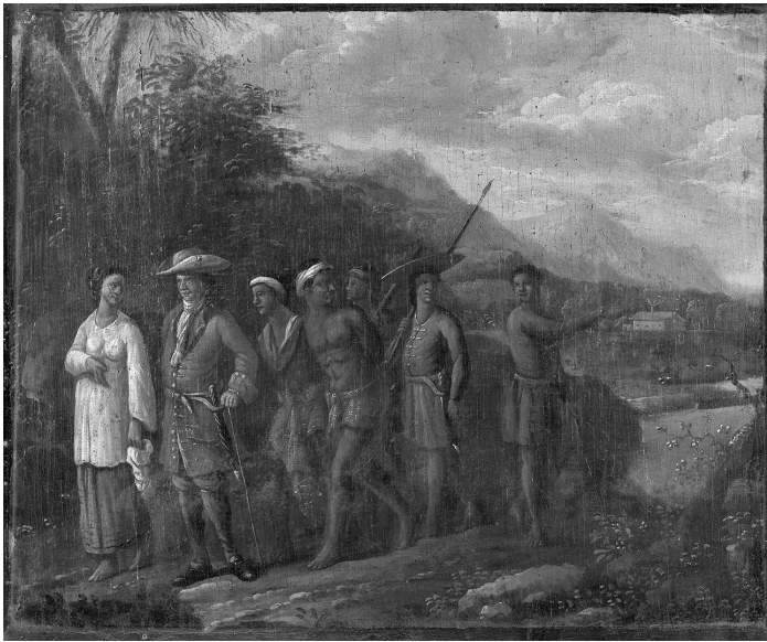
Illustratie 2: Hollandse koopman met slaven en soldaten in een heuvellandschap in Azië, mogelijk in Indonesische archipel, anoniem, 1700-1725. Collectie Rijksmuseum Amsterdam, SK-A-4988.

namen Europese handelaren intensief deel aan het Aziatische (slaven)handelsstelsel. 20 De Portugezen voorzagen zich na hun vestiging aan de westkust van India voornamelijk van slaven uit Mozambique. Met de groei van het Portugese rijk werden Afrikaanse slaven ook naar meer oostelijk gelegen vestigingen in Azië vervoerd. 21 De komst van de Nederlanders in Azië en hun deelname aan de slavenhandel in de Baai van Bengalen in de eerste helft van de zeventiende eeuw zou hebben geleid tot een schaalvergroting waarin voorheen kleine en gefragmenteerde slavensystemen werden vervangen door grotere, gecentraliseerde slavenmarkten. 22 De inmenging van de Fransen en Engelsen vanaf de tweede helft van de zeventiende en het begin van de achttiende eeuw leidde tot een verdere groei van voornamelijk de slavenhandel op de Oost-Afrikaanse kust. 23